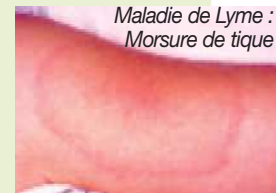
Maladie de Lyme : Morsure de tique

Même en l'absence de morsure de tique évitée, en cas de signes anormaux, de fatigue, de fièvre ou de syndrome grippal en particulier l'été, il faudra penser à signaler à son médecin le fait que l'on est orienteur ainsi que les zones géographiques de courses fréquentées. Cela permettra peut-être de faire le diagnostic d'une maladie à tiques, puisque les tiques peuvent transmettre bien d'autres maladies que la maladie de Lyme, et ainsi pouvoir avoir un traitement précoce adapté.